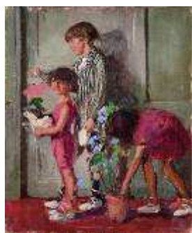
La Sainte Suzanne