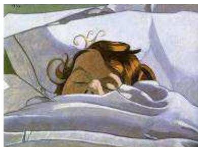
Enfant dormant n°1