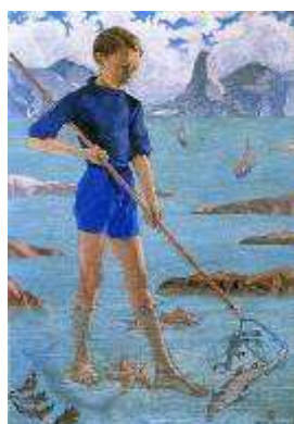
Le Petit pêcheur